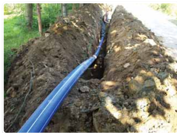
2. budowa kanalizacji sanitarnej wzdłuż potoku Skotnickiego = 700 tys. zł.,